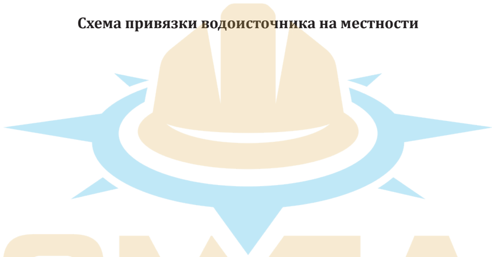
Схема привязки водоисточника на местности